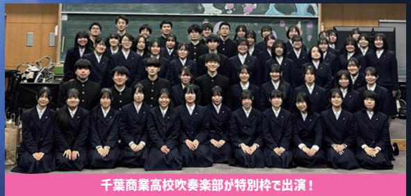
千葉商業高校吹奏楽部が特別枠で出演!